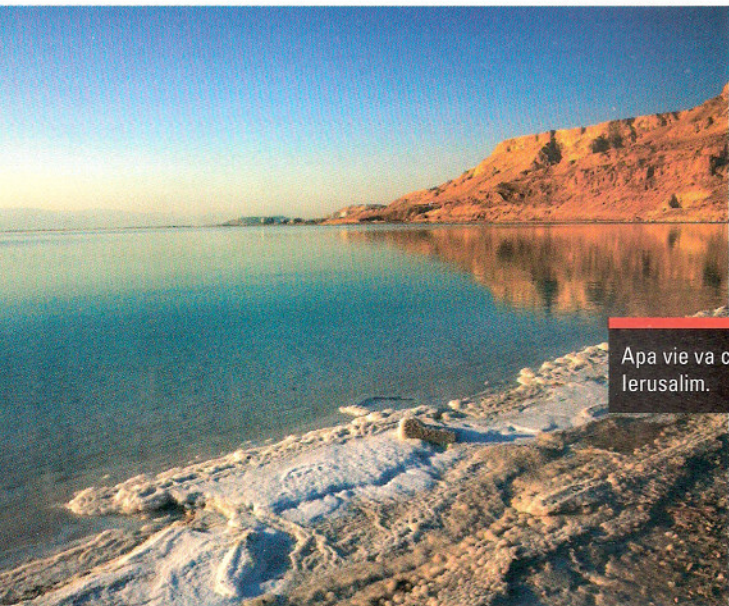
Apa vie va curge în Marea Moartă din Ierusalim.

În cel de-al treilea Templu descris de profetul Ezechiel vor avea însă loc și arderi de tot, iar sângele animalelor va fi folosit în cadrul ceremoniilor (citiți în acest sens Ezec. 40,38-47; 42,13; 43,18-20). Aceste afirmații profetice se referă la Împărăția lui Ieșua, care va domni împreună cu sfinții Săi timp de o mie de ani. Știm însă că jertfele din cel de-al treilea Templu nu vor mai sluji ca ispășire pentru iertarea păcatelor, deoarece această ispășire a fost făcută deja în totalitate pe cruce, în urmă cu două milenii. Viitoarele jertfe din Templu vor avea doar un caracter simbolic, de aduce aminte a jertfei lui Ieșua de pe Golgota. În cel de-al treilea Templu, Ieșua va fi centrul a tot ce se va face. Atunci Templul nu va fi deschis doar pentru evrei, ci pentru toți credincioșii, de pe întreg pământul. ■