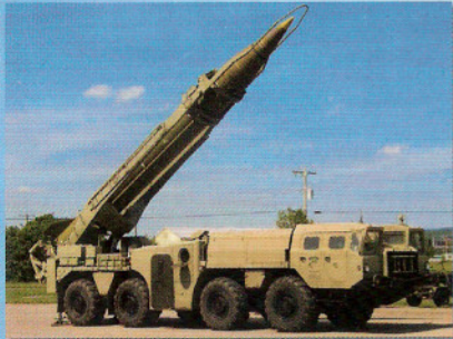
Gevaar voor elke burger in Israël > Pagina 16