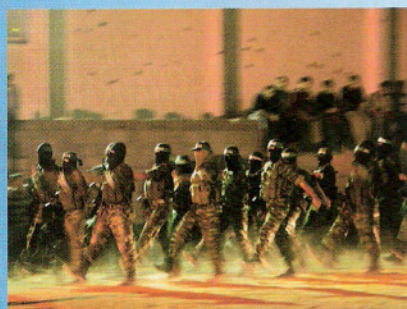
Een nieuwe vijand van Israël > Pagina 20