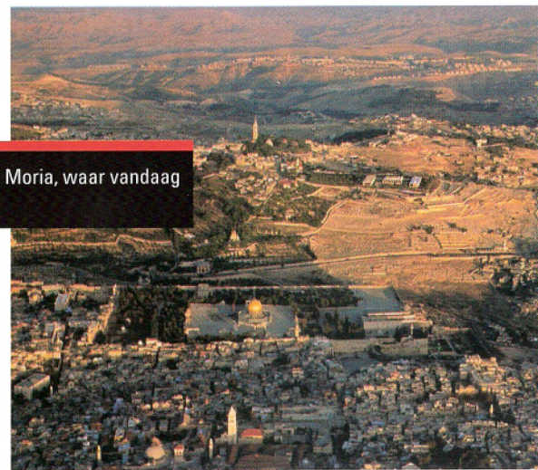
Jeruzalem met de berg Moria, waar vandaag de Omar-Moskee staat

Maar God staat achter Zijn Woord. Ook met betrekking tot de inrichting van de derde tempel op de berg Moria in Jeruzalem zal Hij Zijn plannen en termijnen in acht nemen. Over deze nieuwe