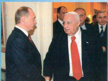
Putin în Israel > Pagina 15