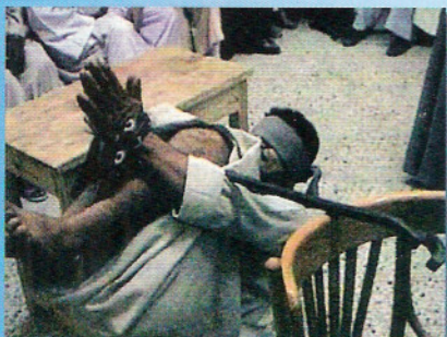
«Iadul» pe pământ > Pagina 14